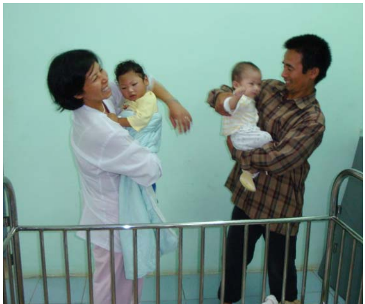
Auf der 'Babystation' in Thuy An.

Auch der nächste Tag war trübe und es regnete immer noch. Die Autobahn stand unter Wasser und war gesperrt, und von den Reis- und Gemüsefeldern war nichts mehr zu sehen. Es schien unmöglich nach Thuy An zu gelangen. Doch unser Fahrer, der sich bestens dort auskennt, fuhr über Deiche, völlig kaputte Straßen und zwischen Maisfeldern hindurch, bis wir schließlich am Ziel waren. Dort wurde ich von dem neuen Direktor des Behindertenheimes begrüßt. Sein Vorgänger, Herr Pham , ist in Rente gegangen, war aber zu meiner Begrüßung gekommen. Neben den 124 zum Teil schwer körperlich und/oder geistig behinderten Kindern werden jetzt auch gesunde aufgenommen. Zur Zeit meines Besuches waren es neun. Dasselbe gilt für Erwachsene. Lebten bisher nur behinderte Erwachsene in dieser Einrichtung, finden jetzt auch nicht behinderte alte, alleinstehende Leute hier Aufnahme.