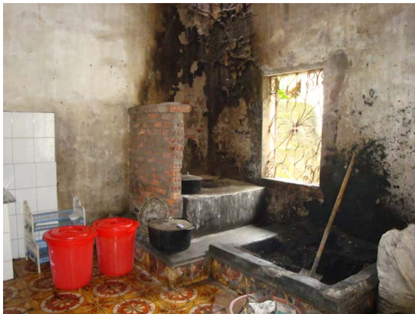
Auch die Küche des Heims hat feuchte Wände.

Am nächsten Morgen starteten wir zu unserem Ausflug. Ziel waren drei Pagoden, die um tonnenschwere Buddha-Figuren herum gebaut wurden. Die Gebäude ziehen sich einen Berghang hinauf, von wo aus man einen fantastischen Blick in die Landschaft hat. Die Pagoden selbst sind derart monströs, dass sie wohl weniger der stillen Einkehr als dem lukrativen Tourismus dienen sollen. Noch war alles im Bau, aber man konnte schon ahnen, welche Ausmaße die ganze Tempelanlage einmal haben wird.